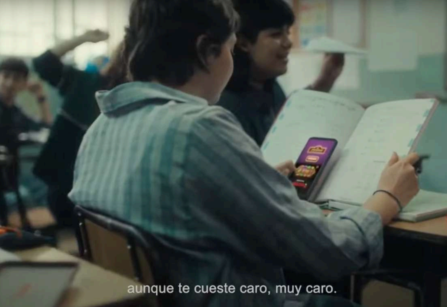
aunque te cueste caro, muy caro.